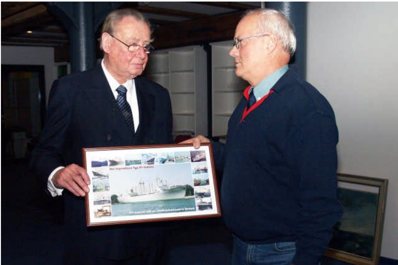
J.M., Seeleute Rostock e.V.