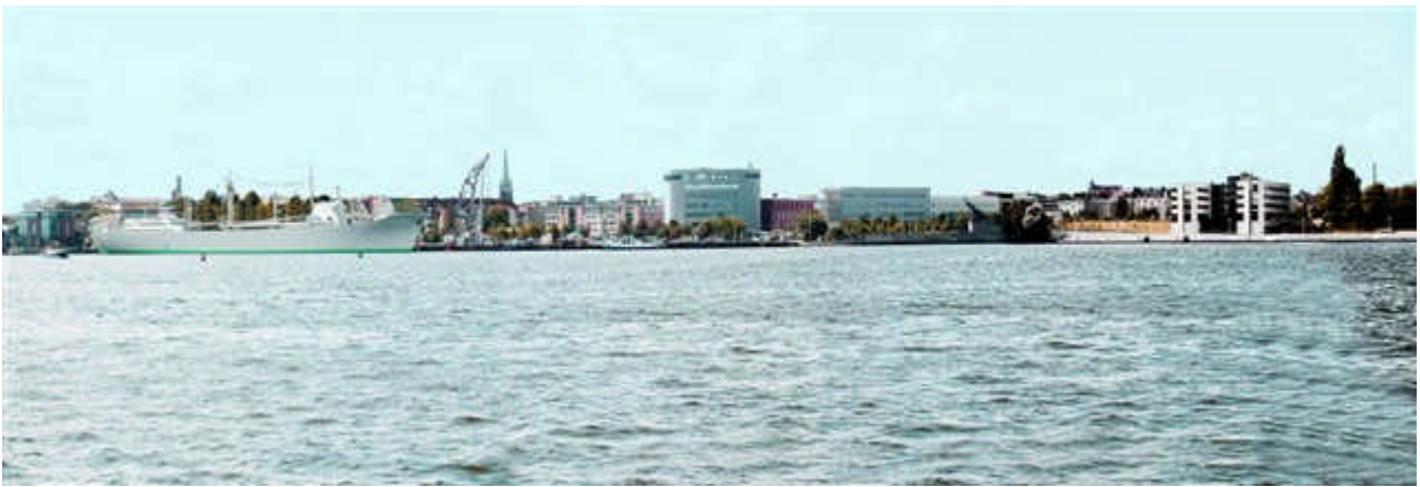
Rostocks Panorama mit dem Traditionsschiff im Stadthafen