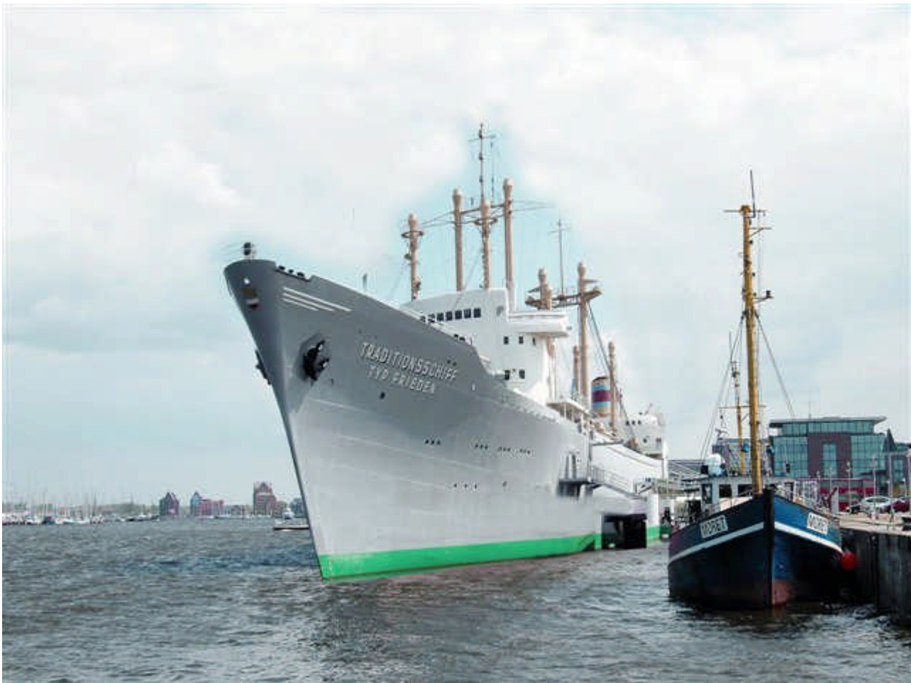
Bugansicht mit Speicher