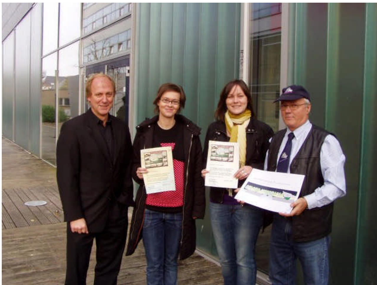
Seeleute Rostock e.V.