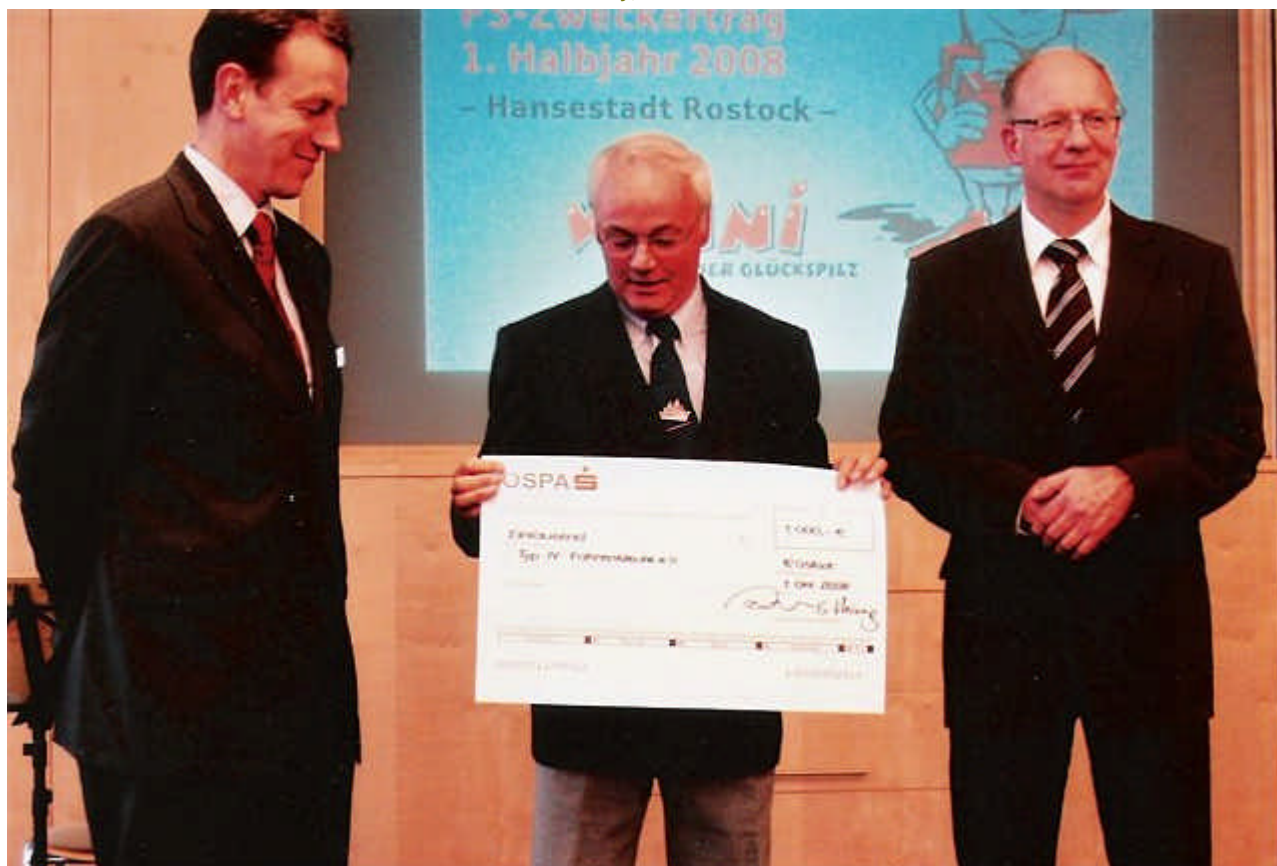
Foto: Die Scheckuebergabe am 01.10.2008